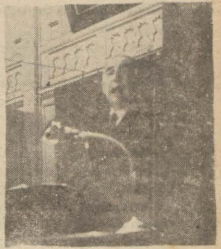
Rektör Cemil Bilsel nutkunu söylerken

Konferans salonunun çatısı altından taşan ve civar sokaklara kadar yayılan gençlerden binlercesi de Rektör Cemil Bilsel'in açılış nutkunu hoparlör tertibatı ile dışarıdan dinliyorlardı. Sesleri Lâleli ve Beyazıt semtlerinde neşeli ve dinç akisler bırakan bu gençlerin her bir (Devamı 2 inci sayfada)