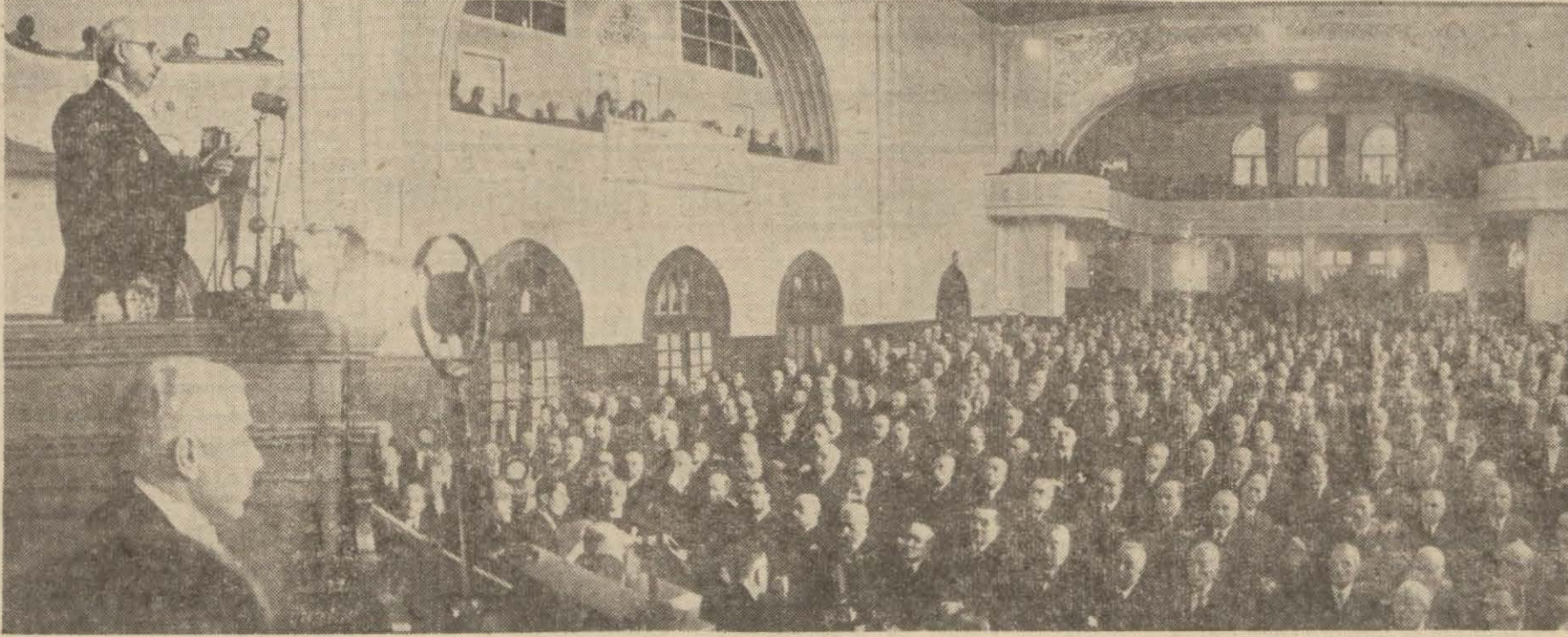
Millî Şefimiz evvelki gün Büyük Millet Meclisinde tarihî nutuklarını irad buyururlarken

Nutkun piyasadaki akisleri de şayanı dikkat oldu: Kara borsada durgunluk başladı, bazı gıda maddeleri bollaştı